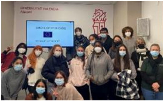
Visita y charla IES Miguel Hernández