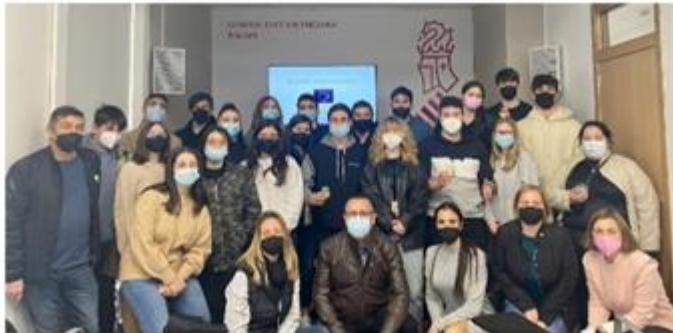
Visita y charla IES Sixto Marco