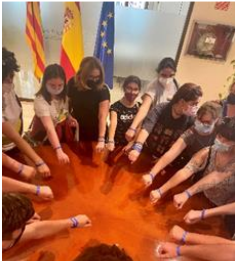
Visita y charla ADIS Diversidad funcional