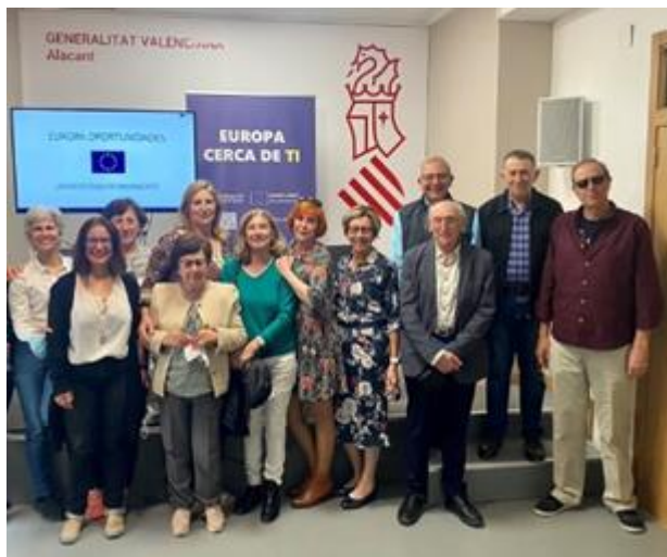
Visita y charla Universidad permanente de adultos

Para todo el equipo de Europe Direct Comunitat Valenciana, fue un orgullo y gran satisfacción recibir este año el reconocimiento de la Delegación del Gobierno con motivo del Día de Europa como entidad que trabaja e impulsa los valores de convivencia y paz de la Unión Europea.