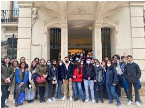
Visita y charla IES Cabo de la Huerta